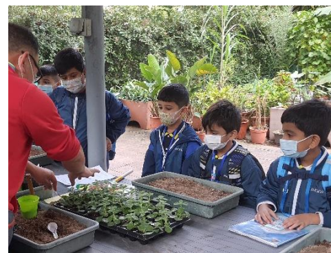
常識科戶外學習日