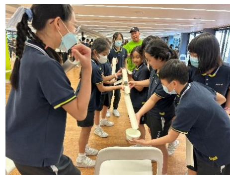
文化體驗活動_感受飲茶文化